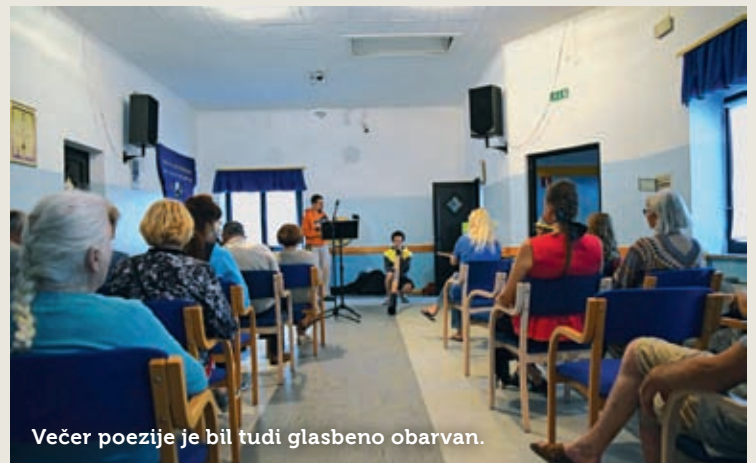
Večer poezije je bil tudi glasbeno obarvan.