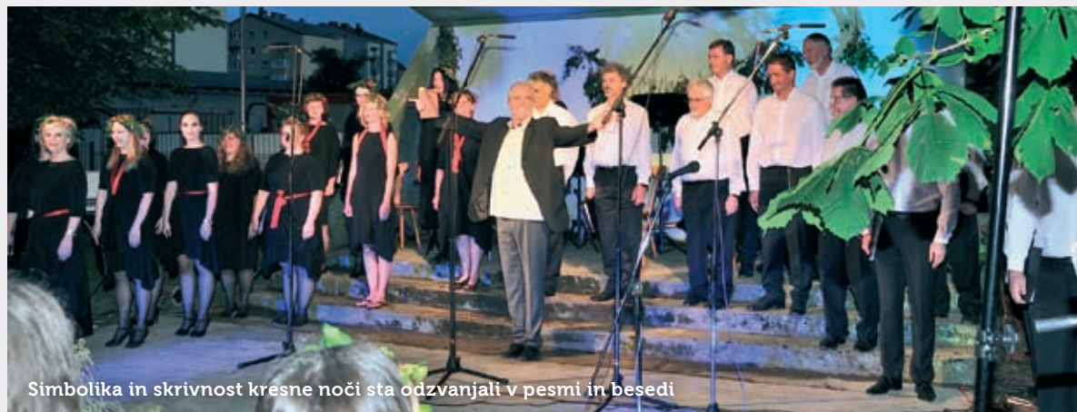
Simbolika in skrivnost kresne noči sta odzvanjali v pesmi in besedi