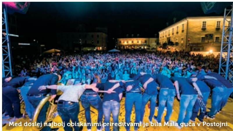
Med doslej najbolj obiskanimi prireditvami je bila Mala guča v Postojni.