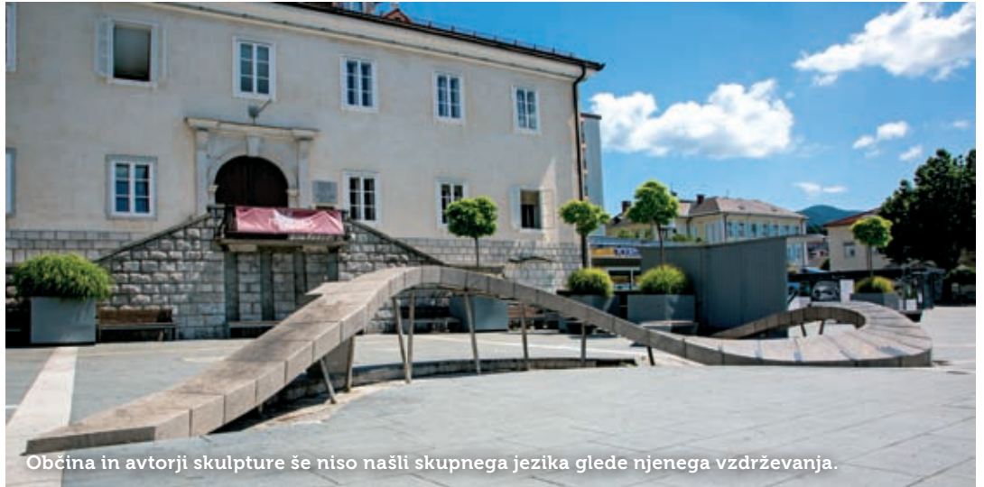
Občina in avtorji skulpture še niso našli skupnega jezika glede njenega vzdrževanja.