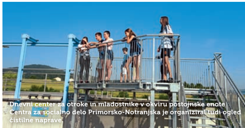
Dnevni center za otroke in mladostnike v okviru postojnske enote Centra za socialno delo Primorsko-Notranjska je organiziral tudi ogled čistilne naprave.

Besedilo: Mateja Jordan; fotografije: arhiv MCP, Dnevnega centra.