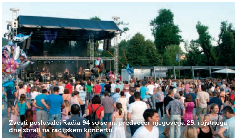
Zvesti poslušalci Radia 94 so se na predvečer njegovega 25. rojstnega dne zbrali na radijskem koncertu.

Prvi julijski večer je bil v znamenju dalmatinskih melodij, za kar je v atriju SAZU-ja poskrbela Vokalna skupina Goldinar z odličnimi gosti – KD Vipavski tamburaši . Poln atrij je ponovno potrdil naklonjenost glasbi, ki prinaša nostalgичne spomine na brezskrbne dopustniške dni.