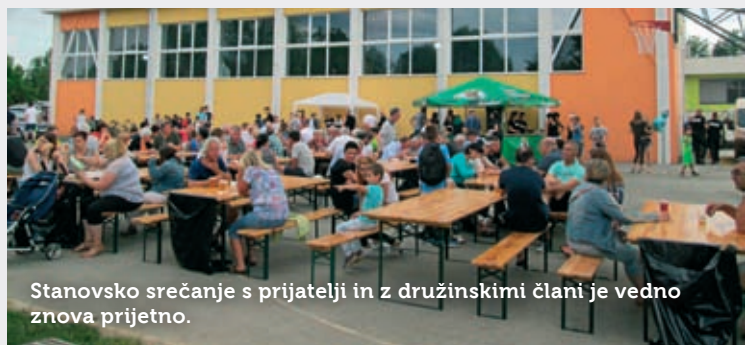
Stanovsko srečanje s prijatelji in z družinskimi člani je vedno znova prijetno.

Združenje šoferjev in avtomehanicov (ZŠAM) Postojna je v začetku julija povabilo na srečanje svoje člane in njihove družine. Uradnemu delu s podelitvijo diplom za dolgoletno članstvo je sledil družinski piknik.