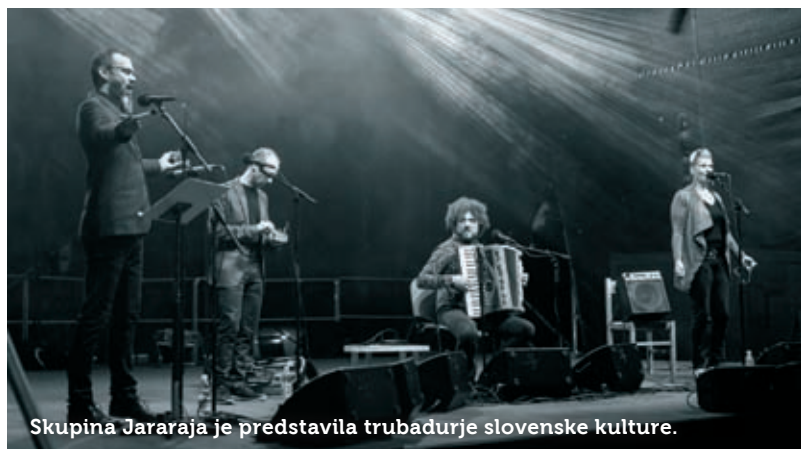
Skupina Jararaja je predstavila trubadurje slovenske kulture.

Besedilo: Ester Fidel; fotografije: arhiv Občine/Petra Režek, Valter Leban.