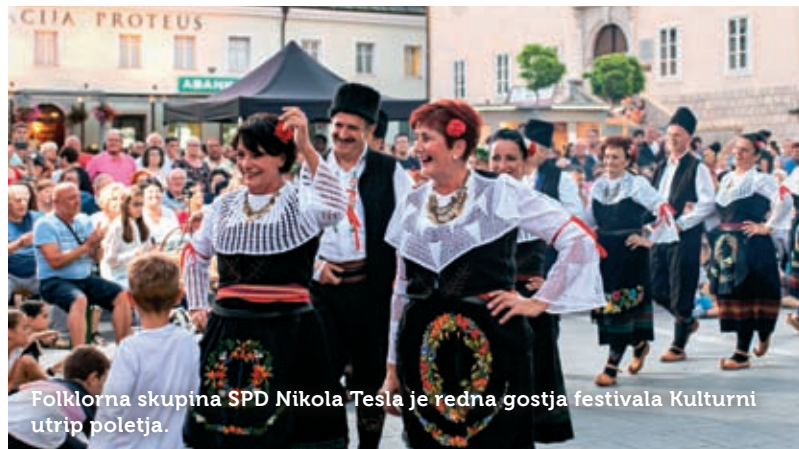
Folklorna skupina SPD Nikola Tesla je redna gostja festivala Kulturni utrip poletja.

Redna gostja postojnskega festivala je tudi Folklorna skupina Vipava . Na letošnjem Vipavskem večeru so ob gostiteljih nastopile še folklorne