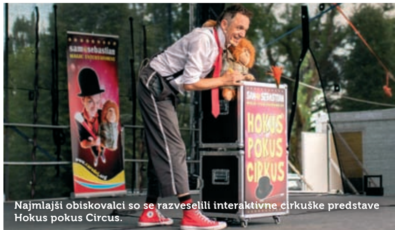
Najmlajši obiskovalci so se razveselili interaktivne cirkuške predstave Hokus pokus Circus.