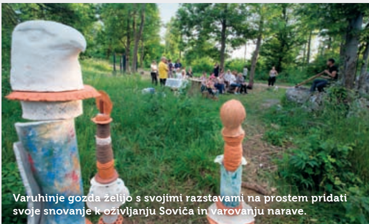
Varuhinje gozda želijo s svojimi razstavami na prostem pridati svoje snovanje k oživiljanju Soviča in varovanju narave.

Navdih so črpale iz staroslovanske mitologije, saj so bili Slovani tesno povezani z gozdom. Svet so predstavljali kot veliko drevo (običajno hrast), in tako tudi ta postavitev Varuhov gozda na Soviču simbolično predstavlja tri drevesa. Na vrhu najvišjega je upodobljen orel, levo in desno od njega pa sta luna in sonce. Letošnja postavitev Varuhov gozda ob Borojevičevi poti je bila rojena na poletni solsticij. Ustvarjalke upajo, da bodo instalacije ostale nepoškodovane in opozarjale vse mimoidoče na možnosti človekovega življenja v sozvočju s samim seboj, s sočlovekom in z naravo. S svojimi razstavami na prostem želijo pridati svoje snovanje k oživiljanju Soviča in varovanju narave.