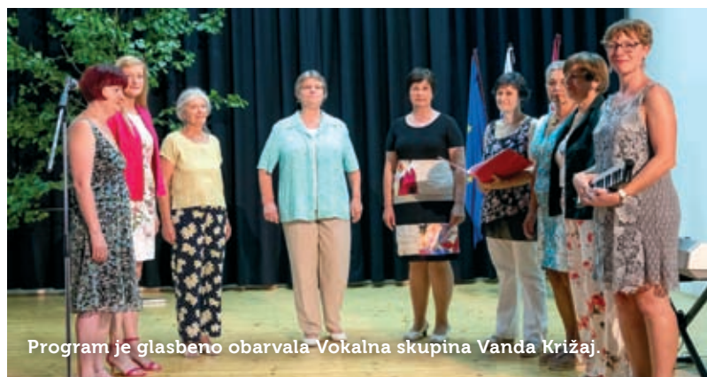
Program je glasbeno obarvala Vokalna skupina Vanda Križaj.