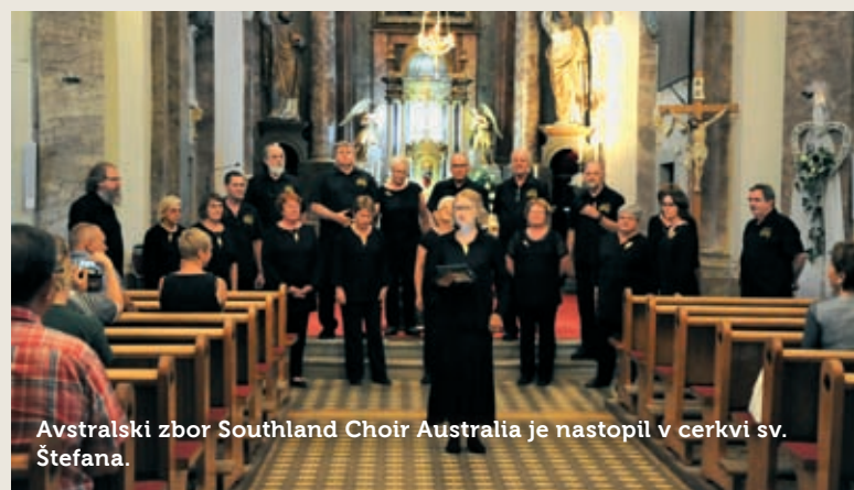
Avstralski zbor Southland Choir Australia je nastopil v cerkvi sv. Štefana.