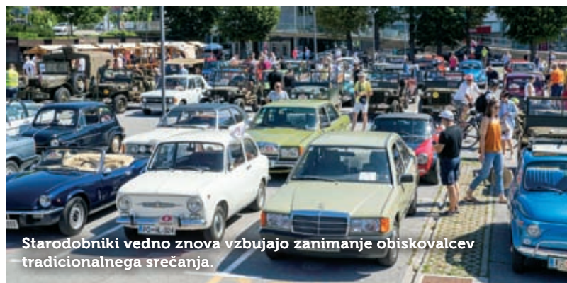
Starodobniki vedno znova vzbujajo zanimanje obiskovalcev tradicionalnega srečanja.