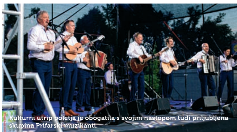
Kulturni utrip poletja je obogatila s svojim nastopom tudi priljubljena skupina Prifarski muzikanti.