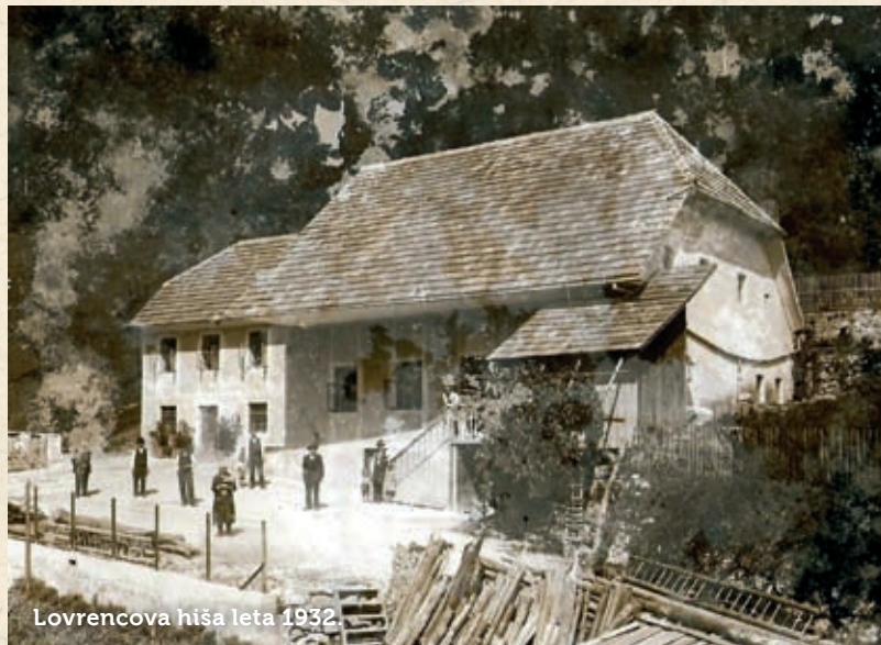
Lovrencova hiša leta 1932.

Lovrencova hiša, današnja Požarjeva gostilna pri Predjamskem gradu, ima dolgo zgodovino. Naslednje leto bo obeležila 100 let uradnega odprtja. Najverjetneje je bila prvotno hiša grajskega oskrbnika, lastniški priimek Požar pa zasledimo prvič v začetku 19. stoletja.