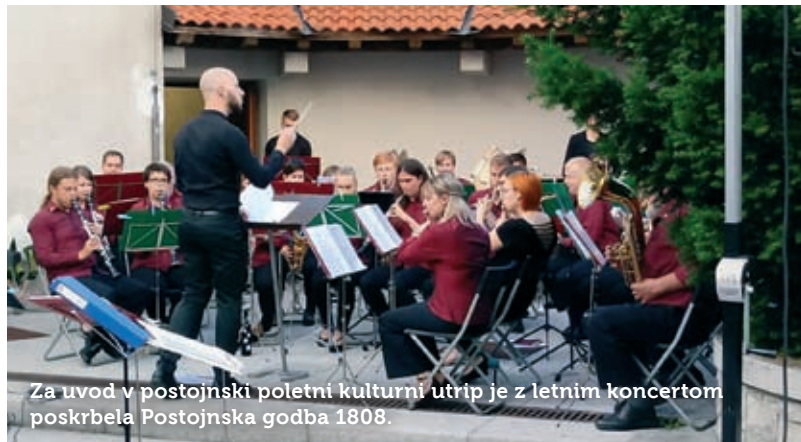
Za uvod v postojnski poletni kulturni utrip je z letnim koncertom poskrbela Postojnska godba 1808.

Od 23. junija se vrstijo v središču Postojne prireditve v okviru enajstega festivala Kulturni utrip poletja. Za njen živahni poletni utrip tudi letos skrbita Občina Postojna in Kulturni dom Postojna, organizacijska enota Zavoda Znanje. Že v prvi polovici je festival doživel nekaj vrhuncev, obeta pa se jih še več. V skupno osmih tednih (vse do sredine avgusta) se bo zvrstilo na Titovem trgu, v atriju SAZU-ja, cerkvi sv. Štefana in še na nekaterih drugih lokacijah petdeset prireditev. Zagotovo so oziroma bodo vsaj katero lahko izbrali po svojem okusu tudi najbolj zahtevni obiskovalci, saj letošnji program prinaša vrsto kakovostnih izvajalcev, pa tudi znanih imen slovenske glasbene scene. Postojna ne bo zapadla mrtvilu niti v drugi polovici avgusta, ko v mesto spet pride Zmaj z mladimi.