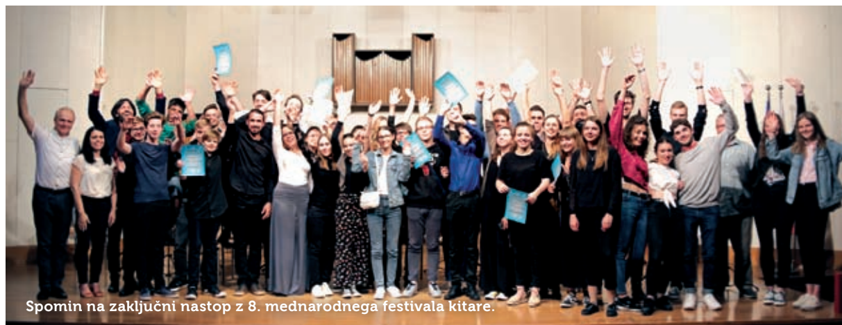
Spomin na zaključni nastop z 8. mednarodnega festivala kitare.

Od 7. do 13. julija se je v dvorani Alojza Srebotnjaka na Glasbeni šoli Postojna in v postojnski cerkvi sv. Štefana odvijalo sedem koncertov. Tovrstna senzibilna glasba razveseljuje izbrani krog poslušalcev in ti (resnici na ljubo jih je bilo manjše število) so prihajali zvesto in hvaležno. Bolj kot število poslušalcev je pomembna številčnost udeležencev kitarske poletne šole – študentov širom sveta, predavanj in mojstrskih tečajev,