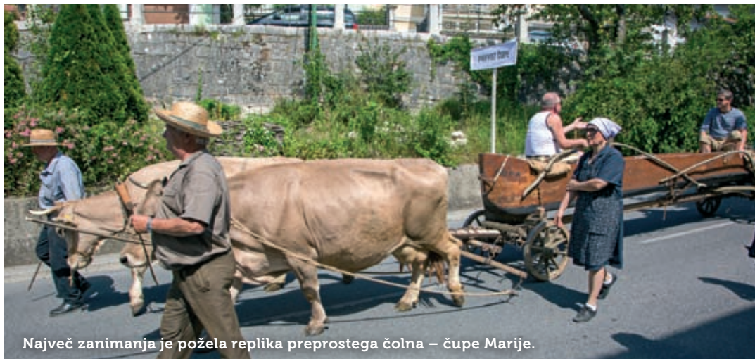
Največ zanimanja je požela replika preprostega čolna – čupe Marije.

Furmanstvo je predstavljalo za lokalno prebival-