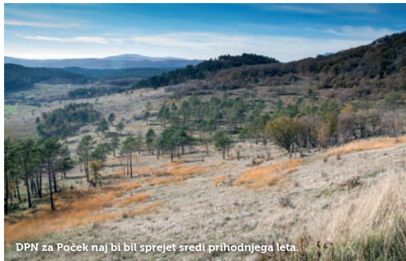
DPN za Poček naj bi bil sprejet sredi prihodnjega leta.

Kot pojasnjujejo na Morsu , bodo zdaj naročili izdelavo vseh strokovnih podlag in celovite presoje vpliva na okolje. Potem ko bosta študija variant in okoljsko poročilo predstavljena javnosti, bodo mnenja podali tudi državni in lokalni nosilci urejanja prostora. Postopek se bo nadaljeval z usklajevanjem in morebitnimi dopolnitvami ter izdelavo podrobnejših idejnih rešitev. Če bo treba, bodo v tej fazi pripravili dodatne strokovne podlage za DPN. Ta bo šel nato skupaj z okoljskim poročilom v ponovno javno obravnavo. Na Morsu računajo, da bodo uredbo o DPN za Poček posredovali vladi v sprejem sredi prihodnjega leta.