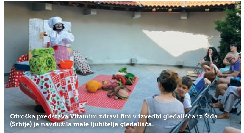
Otroška predstava Vitamini zdravi fini v izvedbi gledališča iz Šida (Srbije) je navdušila male ljubitelje gledališča.