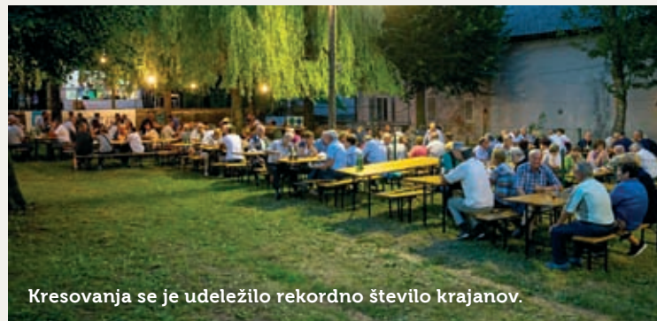
Kresovanja se je udeležilo rekordno število krajanov.

Prizadevne organizatorje 16. kresovanja na Prestranku so obiskovalci nagradili na najlepši način – vabilu se je 21. junija namreč odzvalo več kot 350 krajanov.